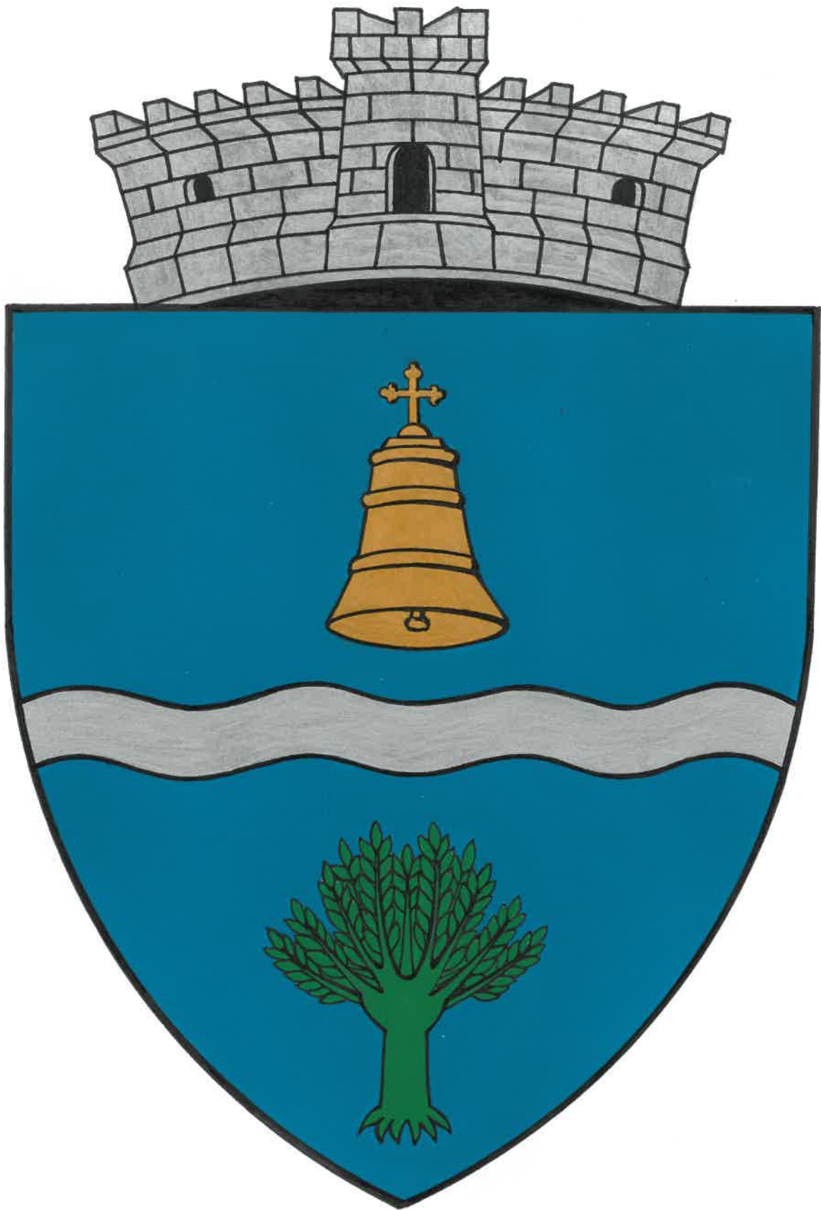
VARIANTA NR. 1